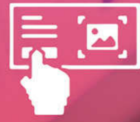
Photo & Videography